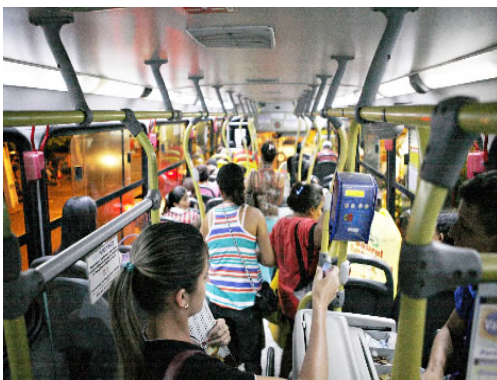
Último ajuste foi feito em dezembro do ano passado

pagará R$ R$ 1,90 - quinze centavos mais caro e acréscimo mensal de R$ 3,60 para aqueles que se deslocam diariamente para trabalhar.