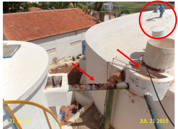
Foto 4 - RAP-01 e F-01: ausência de tampa de inspeção, tubulação de ventilação sem tela de proteção e tubulação de saída de água do F-01 em processo de corrosão.