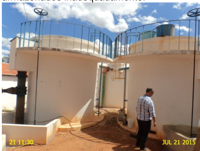
Foto 10 - F-01 e F-02: ausência de identificação e com pintura deteriorada.