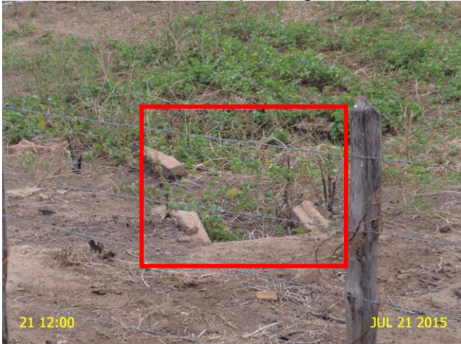
Foto 15 - RDA: registro de descarga com caixa danificada (Rua Bom Sucesso).

Não conformidade NC2 – Resolução ARCE nº 147/2010, Anexo I, item 01.07 : Não realizar operação e manutenção adequada das unidades integrantes do sistema de abastecimento de água.