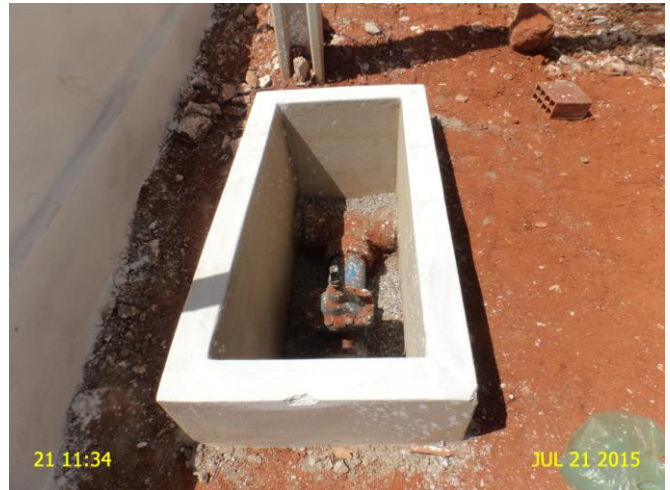
Foto 14 - ETA: caixa de inspeção do registro sem tampa ou grade protetora.