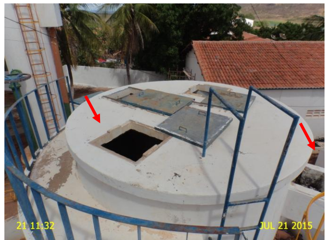
Foto 2 - F-01: tampa fora do local e calha de saída de água sem tampa.