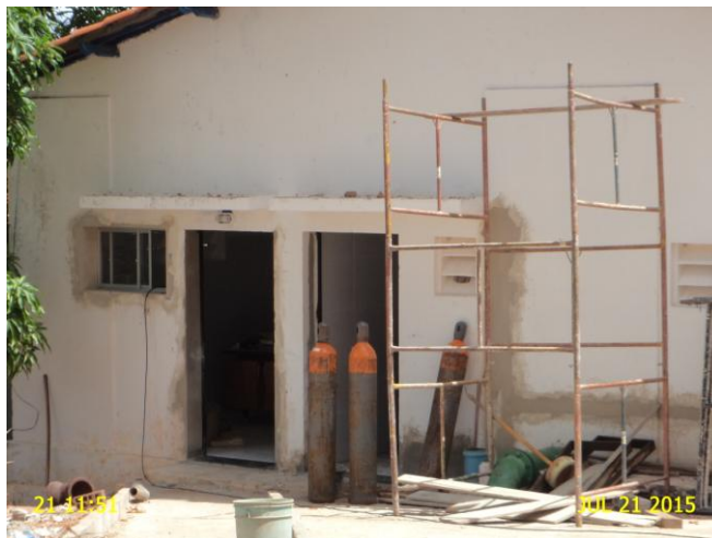
Foto 8 - ETA: cilindros de cloro gasoso armazenados inadequadamente.