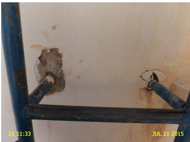
Foto 9 - F-02: escada de acesso sem fixação na estrutura do filtro.