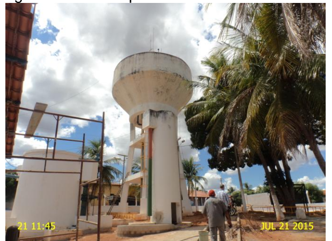
Foto 6 - REL-01: pintura deteriorada, ausência de identificação, guarda corpo e sinalização noturna.

Não conformidade NC1 – Resolução ARCE nº 147/2010, Anexo I, item 01.06 : Não cumprir as normas técnicas e os procedimentos estabelecidos para a implantação das instalações do sistema de abastecimento de água.