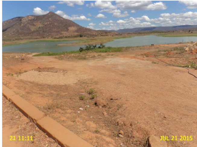
Foto 16 - Captação superficial: ausência de identificação de que a área é destinada ao abastecimento público.

3.1. Na captação, não existe sinalização indicando que aquela área é destinada ao abastecimento público ( Foto 16 ; Anexo II – item 3).