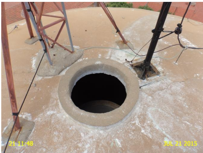
Foto 5 - REL-01: ausência de tampa de inspeção e de tubulação de ventilação.