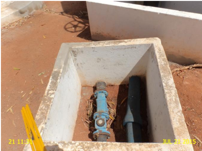
Foto 13 - ETA: caixa de inspeção do macromedidor sem tampa ou grade protetora.