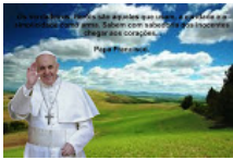
Jorge Mario Bergoglio (Eleito Papa Francisco) Dia 13/03/2013