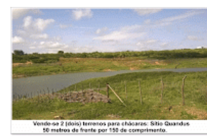
Vende-se 2 (dois) terrenos para chácaras. Sítio Quandus. 50 metros de frente por 150 de comprimento.

Vende-se 2 (dois) terrenos para chácaras no Sítio Quandus, em Catarina: 50 metros de frente por 150