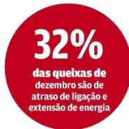
Solicitações de emergência demoram 11h para serem solucionadas

ocorre há três anos e prejudica mais aos clientes residenciais. "Eles sabem que existe esse problema, estão tentando resolver, mas não houve melhoria", diz.