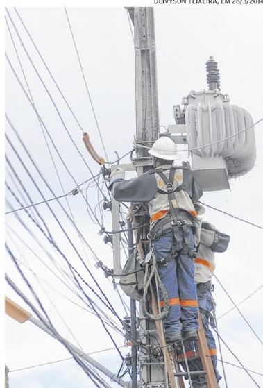
DEIVYSON TEIXEIRA, EM 28/3/2014

Outro fator de queixas é demora no atendimento de ligações ou extensões