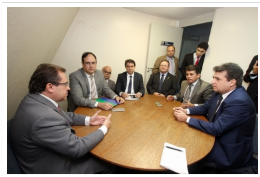
Reunião da ARCE com deputados