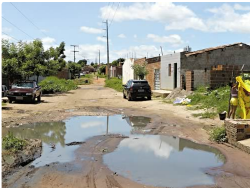
Falta de esgoto é um dos problemas que destaca negativamente o Município no País.

Cidades do Cariri são apontadas com os piores índices de saneamento do Estado. A situação mais preocupante é a deste município, que se encontra no 6º lugar no País nos indicadores negativos.