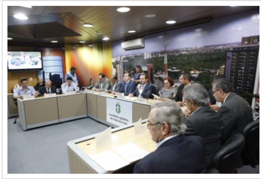
Audiência pública debate reajuste de 12,97% da tarifa de energia no Ceará