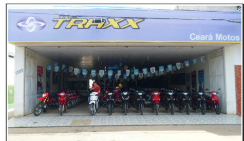
RUA: CEL. ANTÔNIO JOAQUIM, 1566. (EM FRENTE AO DETRAN). TEL.: 3423-1861 / 9 9777-7133.