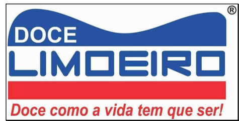
Rua Joaquim Evaristo Gadelha, 2919 - Santa Luzia - Limoeiro do Norte - CE Contato (88) 3423-4436