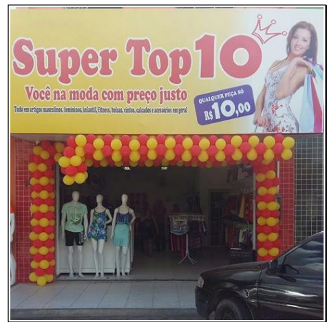
Av. Dom Aureliano Matos, ao lado da Drogaria Nordeste