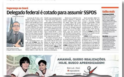
Na última terça-feira, 3, O POVO divulgou que o delegado federal era um dos mais cotados para ocupar cargo de titular da SSPDS