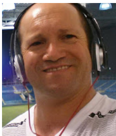
Radialista da SomZoomSat