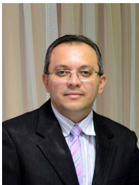
Por Eronildo Rodrigues