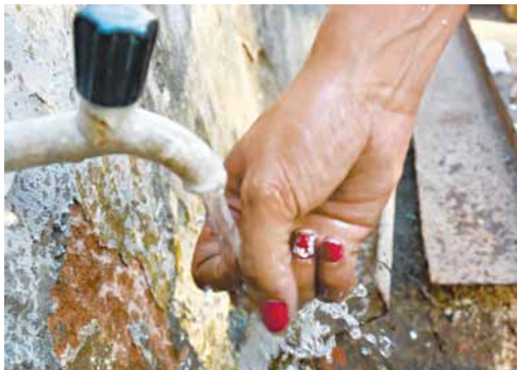
Consumidores cearenses pagarão, em média, R$ 3,17 pelo metro cúbico. Valor antes do reajuste era de R$ 3,03.

Freitas explicou que o reajuste poderá atingir o teto de 17,23% caso a companhia avalie ser necessária a mudança nas taxas durante o ano. “Em tese as revisões são anuais, mas acontecem de haver reajustes extraordi-