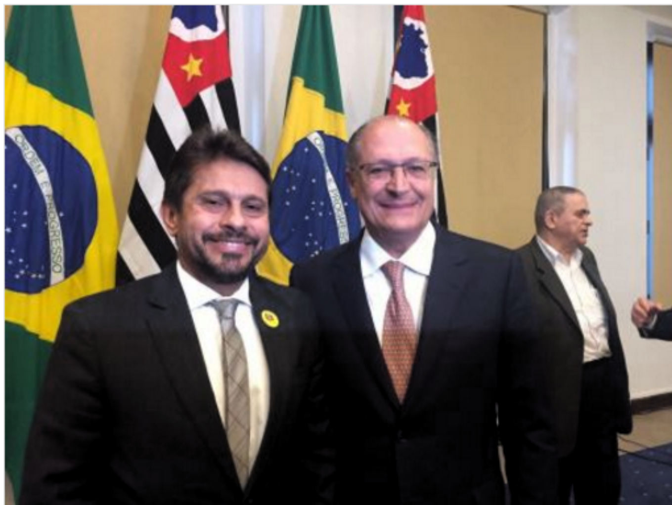
Hélio Winston Leitão e Geraldo Alckmin