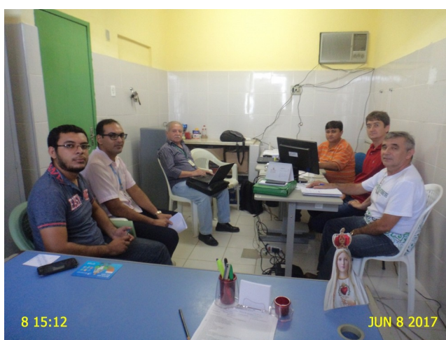
Foto 1 - Reunião de acompanhamento do PMSB.