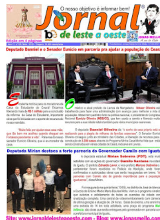
Edição do mês de maio de 2018

jrangel@secrel.com.br – (0**85) 99906-0706