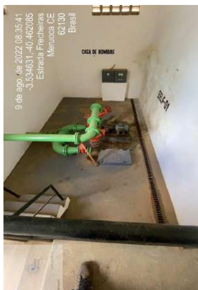
Foto 3 - Ausência de bomba reserva na EELF da ETA.