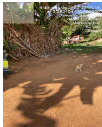
Foto 2 - Registro de descarga soterrado.