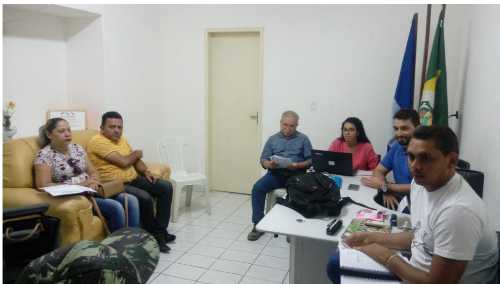
Figura 2 - Reunião de Acompanhamento do PMSB 1

detectar os níveis de execução do PMSB do Município de Saboeiro e orientar os responsáveis acerca dos principais problemas observados ( Figura 2 ).