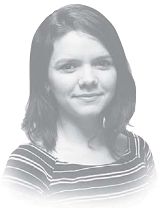
Lorena Cardoso Editora