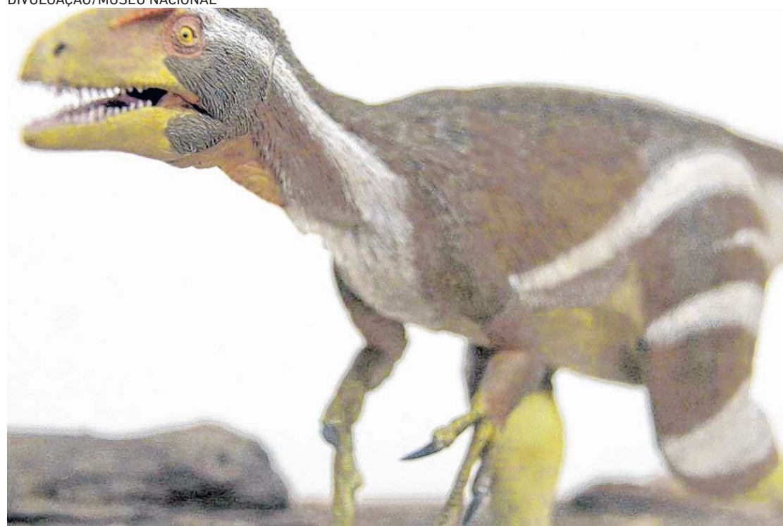
Apresentação da descoberta do Aratasaurus museunacionali

Pesquisadores da Universidade Federal de Pernambuco, do Museu Nacional e da Universidade Regional do Cariri apresentaram ontem, 10, um fóssil de dinossauro de uma espécie inédita encontrado em 2008 na unidade geológica Formação Romualdo, no Ceará, o Aratasaurus museunacionali, animal terrestre e carnívoro. A pesquisa foi publicada na revista do Grupo Nature – Scientific Reports. Ilustração de como deve ter sido o Aratasaurus museunacionali.