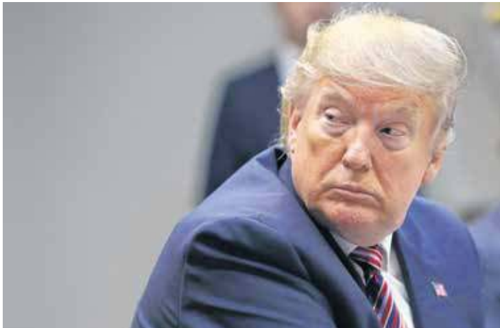
DONALD Trump no início de dezembro

O presidente dos Estados Unidos, Donald Trump, está enfrentando a revelação do jornal The New York Times sobre sua situação fiscal. A questão eclodiu às vésperas do primeiro debate da campanha presidencial com o rival democrata, Joe Biden, em que o presidente vai ter de se impor caso queira recuperar espaço nas pesquisas.