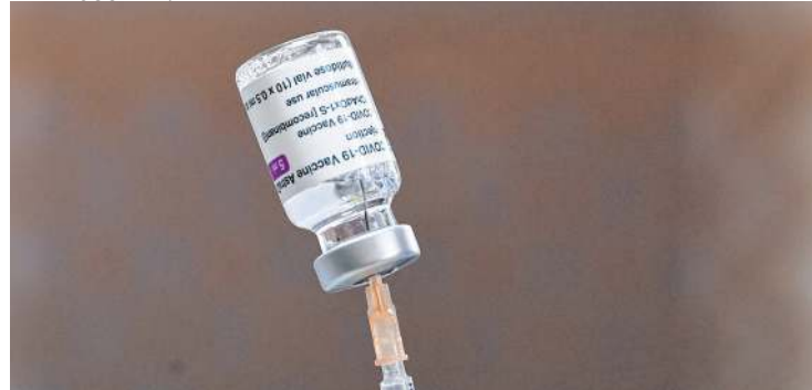
A VACINA é produzida no Brasil pela Fiocruz

A África do Sul suspendeu os planos para inocular seus profissionais de saúde da linha de frente contra o novo coronavírus com a vacina Oxford-AstraZeneca. Um pequeno ensaio clínico com resultados ainda preliminares sugeriu que a vacina não seria eficaz para prevenir a manifestação leve a moderada da Covid-19 causada pela variante dominante no país.