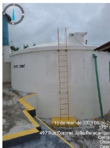
Foto 7 ETA: RAP-02 não possui guarda-corpos e a escada não possui gaiola de proteção.