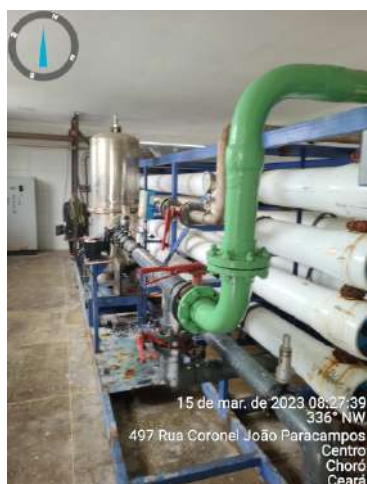
Foto 6 ETA: dessalinizador equipamento adquirido e não utilizado.

Recomendação R4 - A CAGECE deve realizar campanha de divulgação, junto à população do município, acerca dos critérios elegíveis para enquadramento da Tarifa Social, a fim de promover o recadastramento dos potenciais usuários desta categoria.