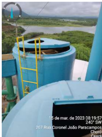
Foto 4 ETA: F-01 e F-02 sem tampa e com tampa deslocada.