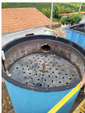
Foto 7 - ETA - Flocculadores desativados.