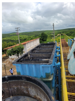
Foto 6 - ETA - Flocculadores desativados.