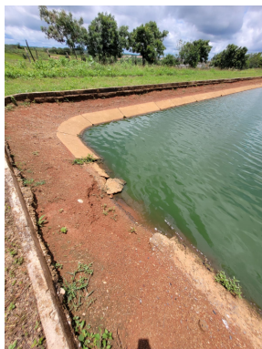
Foto 9 - ETE - placas desagregando em vários pontos da Lagoa Facultativa.