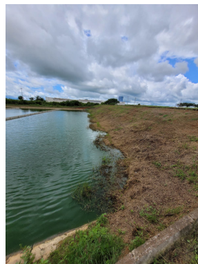
Foto 10 - ETE - LM1 está com uma lateral sem placa de concreto no perímetro.