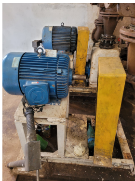
Foto 11 - EEE-01 - bomba reserva não está instalada.