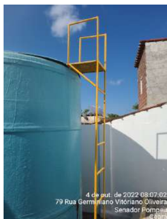
Foto 1 - ETA: as escadas dos filtros não estão fixadas adequadamente e estão oxidadas.