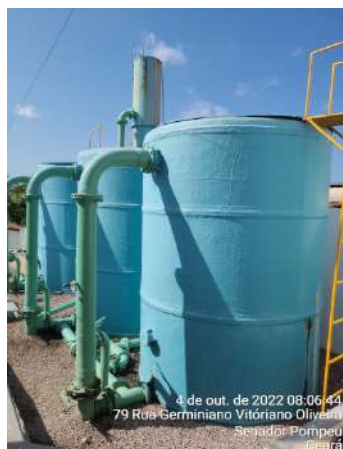
Foto 3 - ETA: ausência de identificação nos filtros