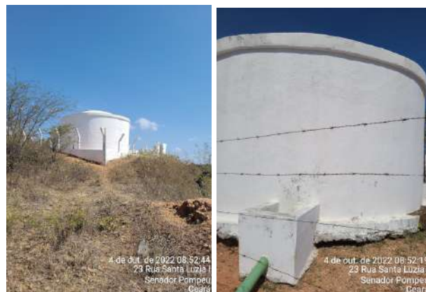
Foto 12 - RAP-02: ausência de identificação.