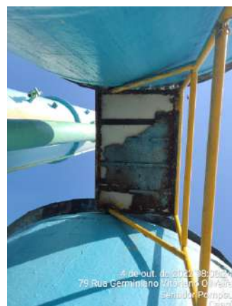
Foto 2 - ETA: as escadas dos filtros não estão fixadas adequadamente e estão oxidadas.