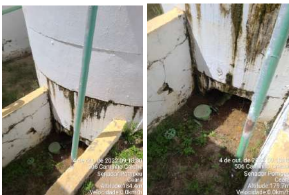
Foto 15 - RAP-03: possui vazamento, falta tampa/grade de proteção na caixa do registro