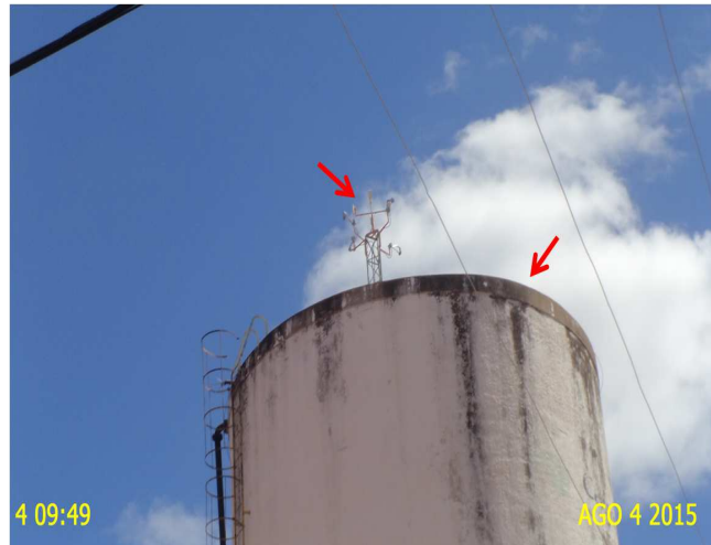
Foto 1 – REL-01: sem guarda-corpos e sinalizador e pintura deteriorada.

Não conformidade NC1 – Resolução ARCE nº 147/2010, anexo I item 01.06 : Não cumprir as normas técnicas e procedimentos para implantação de sistema de abastecimento de água.