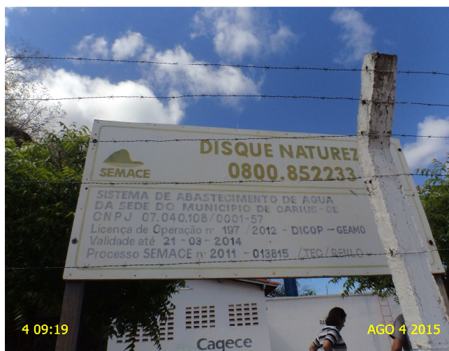
Foto 8 – ETA: placa com data de validade da Licença de Operação da SEMACE vencida desde 21/03/2014.

6.1.A Licença de Operação da Superintendência Estadual do Meio Ambiente – SEMACE para o SAA da Sede do Município de Cariús está vencida desde 21/03/2014 (Foto 8; Anexo II, item 7).