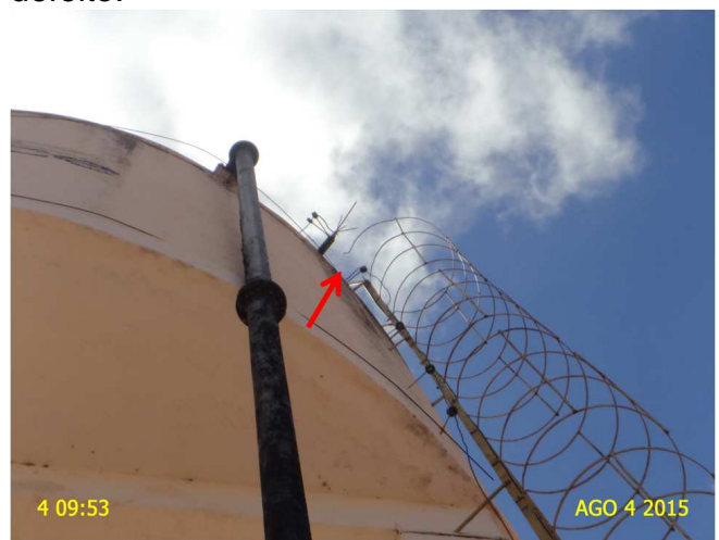
Foto 7 – REL-01: gaiola protetora da escada de acesso sem fixação na estrutura do reservatório.