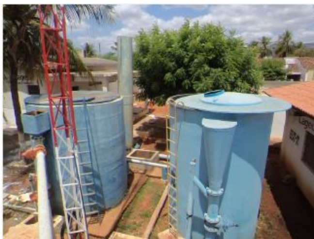
Foto 2 – Filtros: tampas.

Constatou-se que a CAGECE providenciou as tampas para os filtros da ETA. No entanto, a abertura de inspeção de um filtro está sem a tampa ( Foto 2 ).