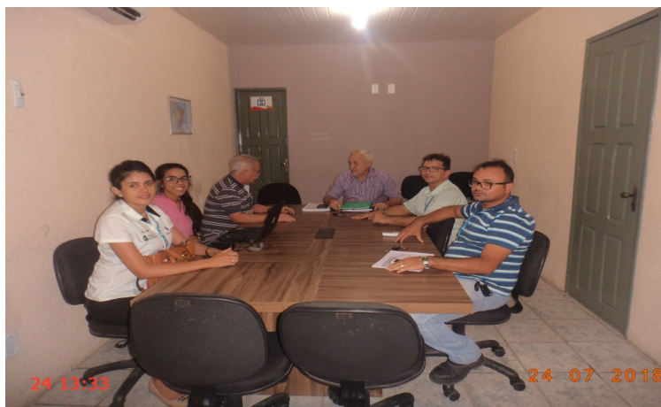
Figura 2 - Reunião de Acompanhamento do PMSB 1

detectar os níveis de execução do PMSB do Município de Caridade e orientar os responsáveis acerca dos principais problemas observados ( Figura 2 ).