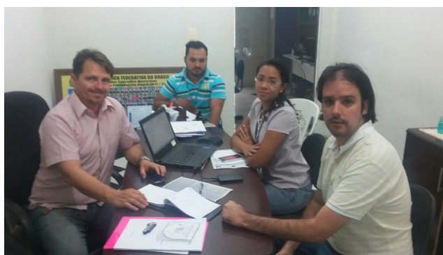
Foto 1 - Reunião de acompanhamento do PMSB.