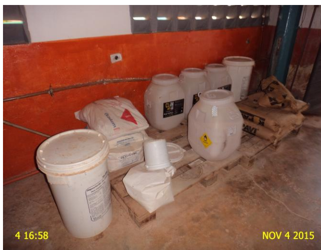
Foto 4 – Casa de química: produtos químicos armazenados adequadamente em estrados de madeira.

Na visita constatou-se, que os produtos químicos estão armazenados adequadamente em estrado de madeira ( Foto 4 ). Desta forma, a determinação está atendida.