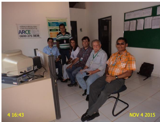
Foto 1 – 1ª reunião de acompanhamento do PMSB com os representantes da CAGECE.

Estas reuniões tiveram o objetivo de detectar os níveis de execução do PMSB do Município de Granjeiro e orientar os responsáveis acerca dos principais problemas observados.