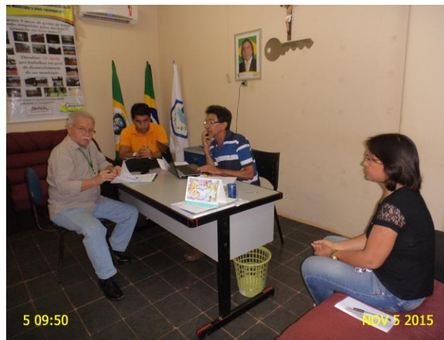
Foto 2 – 2ª reunião de acompanhamento do PMSB com os representantes da Prefeitura Municipal de Granjeiro.