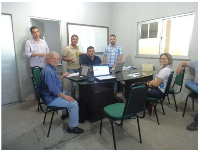
Foto 1 - Reunião de acompanhamento do PMSB.