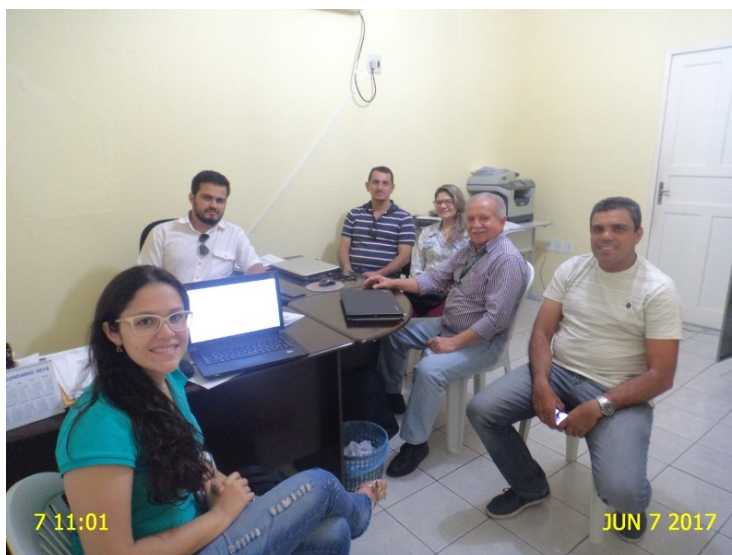
Foto 1 - Reunião de acompanhamento do PMSB.