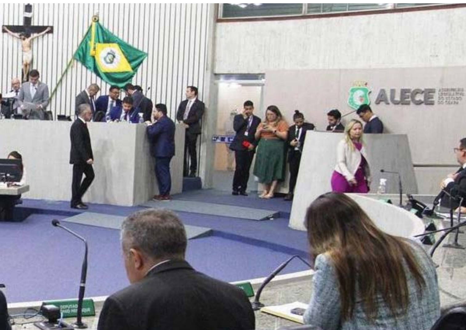
Três siglas ainda não enviaram a indicação de seus líderes

“O que o estatuto diz é que a liderança é escolhida em uma reunião conjunta entre o diretório e a bancada. (...) A gente vai fazer uma reunião, escolher nosso líder e ver como se articula com a Assembleia. A Assembleia não é obrigada a seguir estatuto de partido nenhum, mas o filiado do partido é”.